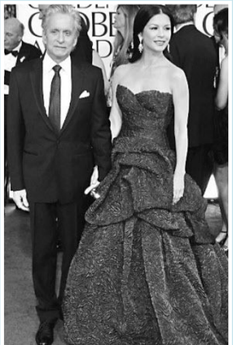
Standing Ovationen für den vom Krebs geheilten Michael Douglas und Gattin Catherine Zeta-Jones.