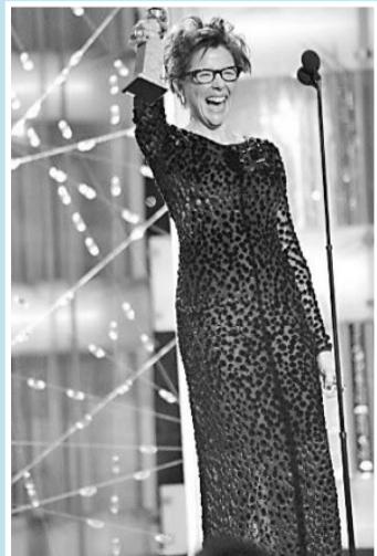
Annette Bening: Beste Darstellerin in einem Musical oder einer Komödie (The Kids Are All right)